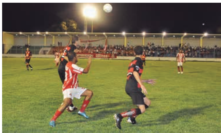
O Estádio da Graça será palco de vários jogos da competição