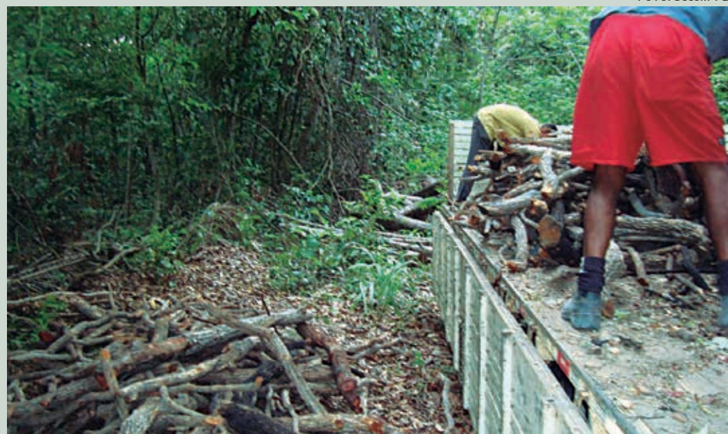
Vistoria feita por equipe técnica da Sudema encontrou uma área devastada de 2,35 hectares

O curso está sendo ministrado por técnicos da Defesa Civil Nacional e terá duração de 32 horas, com encerramento na sexta-feira