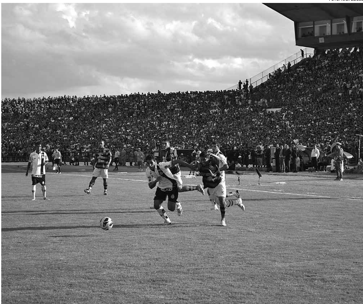
No domingo passado, o Campinense conquistou o mais importante torneio de toda a sua história ao levantar a Copa do Nordeste