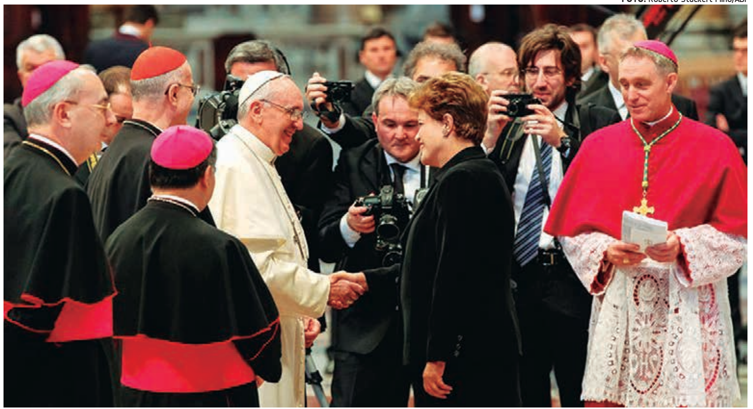
O papa Francisco cumprimenta a presidente Dilma Rousseff após a missa inaugural de seu pontificado, celebrada ontem no Vaticano