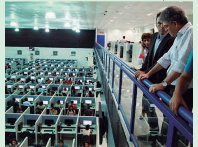
Governador durante visita à unidade da A e C em Mangabeira

O governador Ricardo Coutinho visitou na noite da última segunda-feira (18) o call center da empresa A e C, instalado no antigo Jampa Hall, em Mangabeira, que entrou em operação no dia 1º de março, com 900 funcionários. Até o final do ano, a empresa terá uma nova unidade, chegando ao total de 4 mil postos de trabalho em João Pessoa.