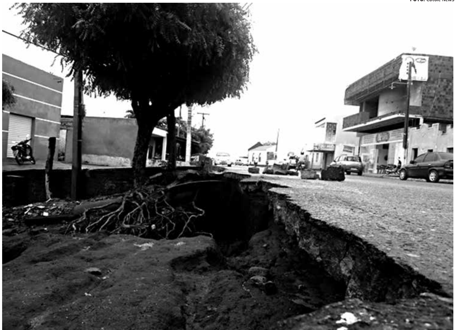
A cidade de Catolé do Rocha, no Alto Sertão paraibano, foi atingida por forte chuva que chegou a causar estragos na Avenida Rui Carneiro

O presidente da Fetag comentou ainda que o homem do campo está mais preocupado é em salvar o gado que ainda resta e ter água. “A questão do lucro com a safra já está em segundo plano, o que queremos realmente é ter água para salvar a metade do gado que ainda vive, ter água para o consumo humano, ter alimento para os animais, porque se não for assim perderemos tudo”, disse.