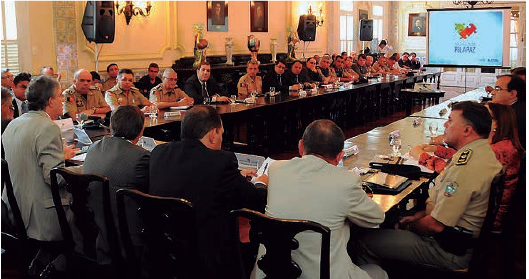
O governador Ricardo Coutinho presidiu a reunião da cúpula da segurança em que foram apresentados os dados sobre a queda da violência

O suco retirado das prateleiras dos supermercados está sob suspeita de não atender às normas de higiene da Anvisa. A equipe do Procon-PB visitou cinco estabelecimentos na capital. PÁGINA 9