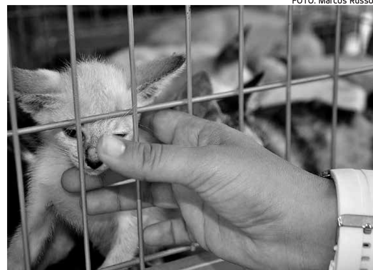
Cachorros e gatos estão expostos no Ponto de Cem Réis

Segundo ele, parte da população desconhece o real papel do Centro de Zoonoses e leva para lá o bicho que não quer mais cuidar. Tal atitude acarreta em superlotação. É necessário que a população