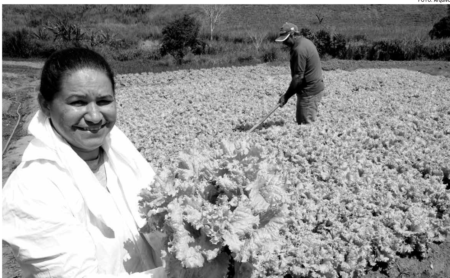
Os alimentos sem agrotóxicos previnem o câncer e doenças cardiovasculares, além de trazer vantagens para o meio ambiente

Na Paraíba, são realizadas cerca de 40 feiras agroecológicas, 16 delas certificadas pelo Ministério da Agricultura, reúnem cerca de 700 famílias de assentamentos da reforma agrária e da agricultura familiar que produzem alimentos de forma natural, sem agrotóxicos. Apenas em duas das feiras agroecológicas de João Pessoa, no Bessa e na UFPB, são vendidas semanalmente cerca de 10 toneladas de alimentos variados, como hortaliças, frutas e raízes.