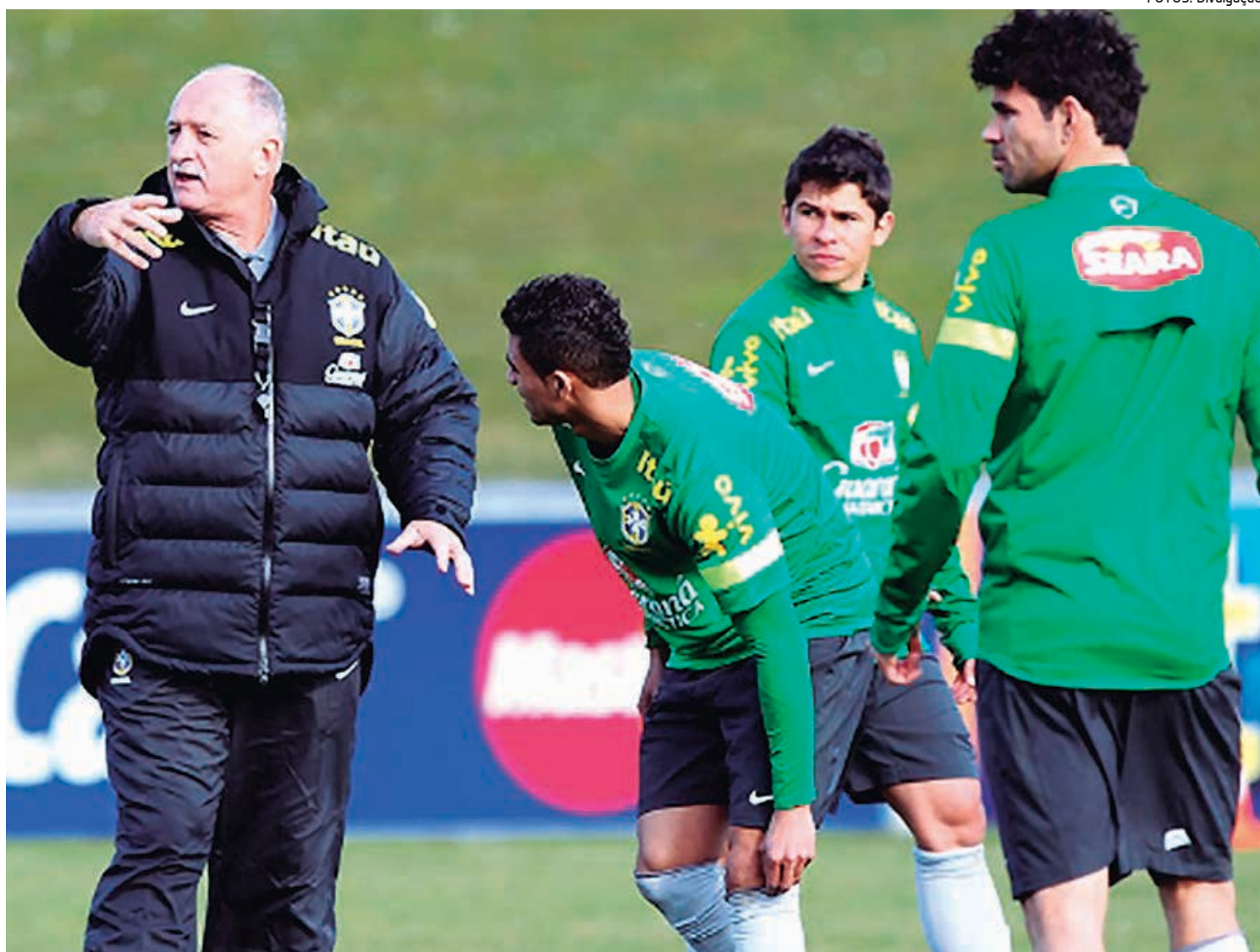
Na segunda parte do treinamento, Felipão testou o esquema 3-5-2, o mesmo utilizado na campanha do pentacampeonato em 2002

Para dar mais proteção, os volantes escolhidos foram Luiz Gustavo e Fernando. Hulk, Neymar e Fred formaram o trio de ataque